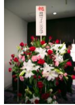
岩槻LCより籠花をいただきました