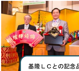
基隆LCとの記念品の交換 基隆LCより扇方の楯とメンバーの名前入りのカップ、大宮LCより兜を贈呈