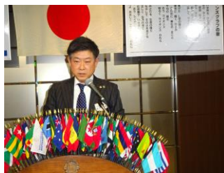
小笠原より大宮アルディージャ 激励会のお話が有りました