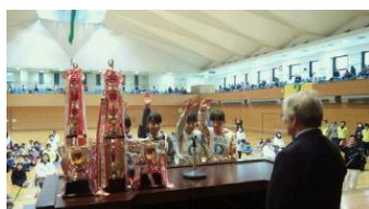
市子連のかるた大会 表彰式